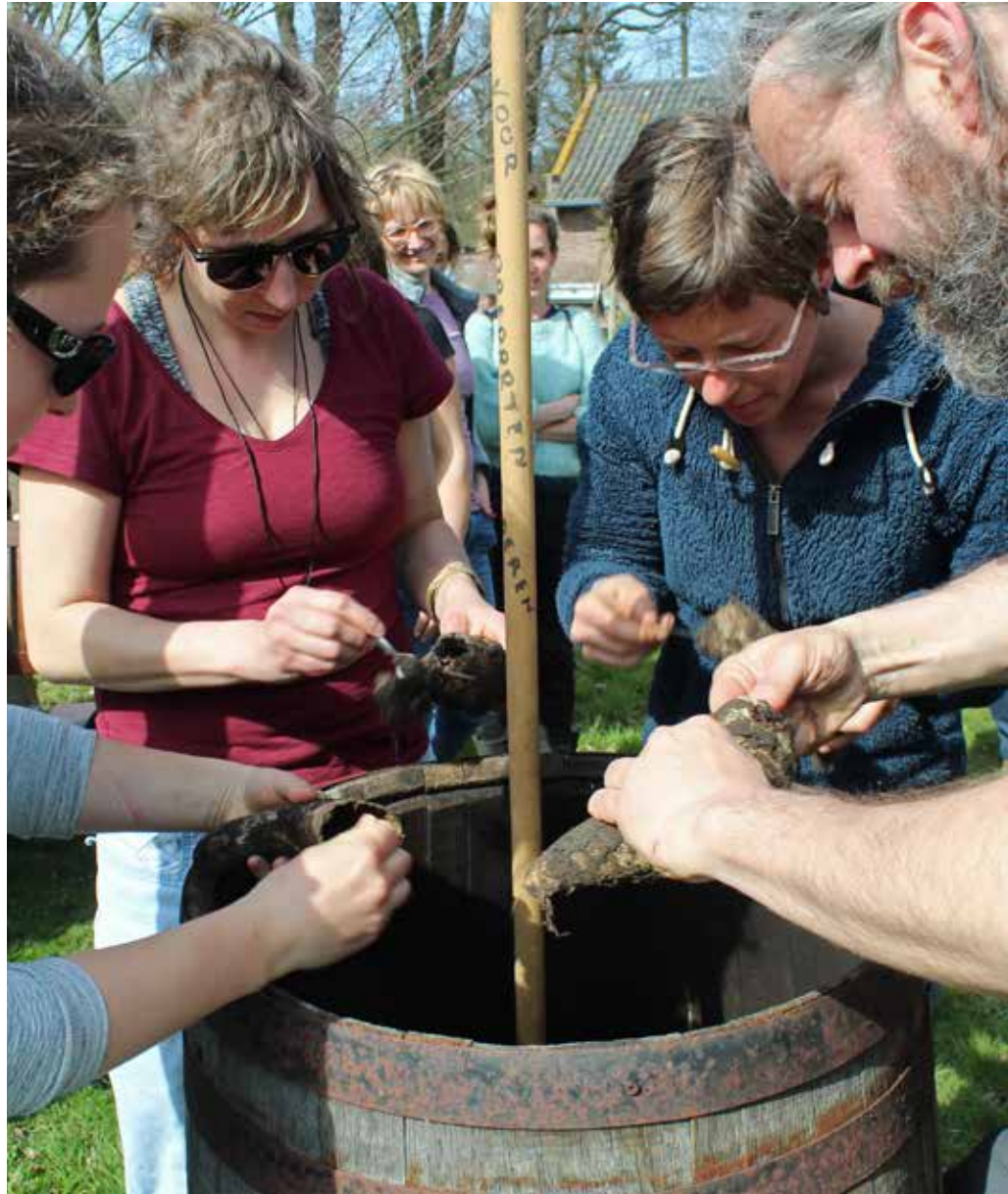
Uitlepelen van het preparaat in de ton met water.