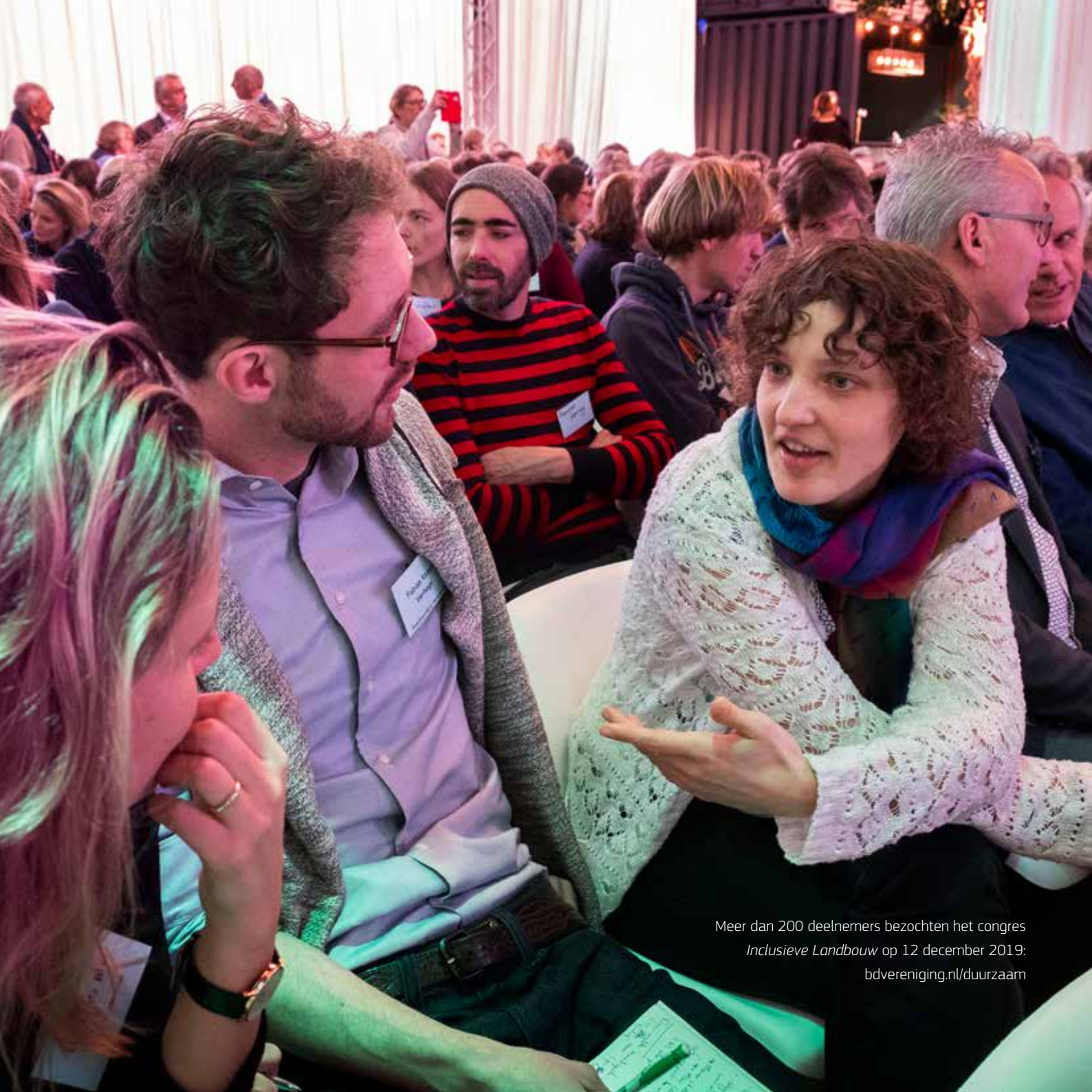
Meer dan 200 deelnemers bezochten het congres Inclusieve Landbouw op 12 december 2019: bdvereniging.nl/duurzaam