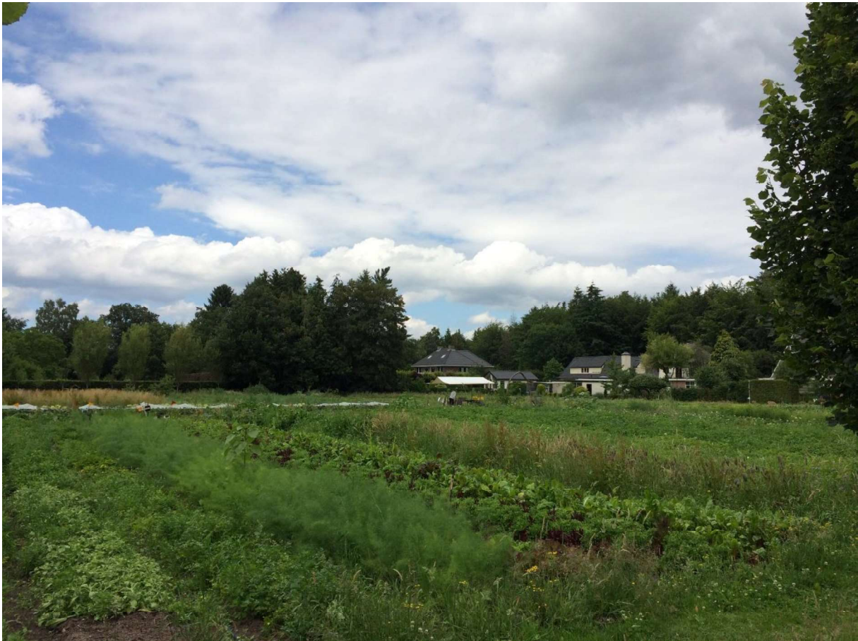
De zelfoogsttuin met rechts op de achtergrond huizen aan de Van Oosthuyselaan en het Rijsenburgse bos.

Zorg voor de bossen en beplanting is een belangrijk aandachtspunt voor behoud van het landgoedkarakter. Er is in de vorige eeuw een tijd een bosgroep geweest. De heg langs de zelfoogsttuin, de beplanting in de bijentuin en de boomgaarden worden regelmatig verzorgd.