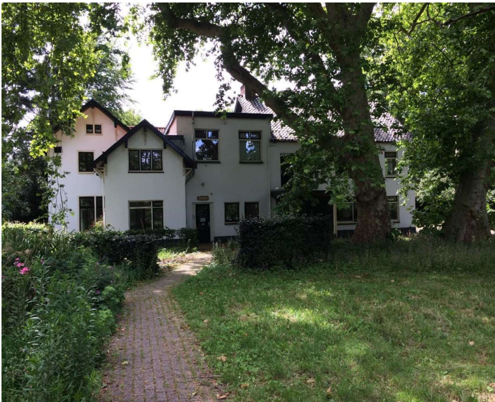
“Het koetshuis” is een samengesteld gebouw van v.m. koetshuis, stal en woning. Het is vaak verbouwd, maar heeft met de oude platanen nog een landgoeditstraling.