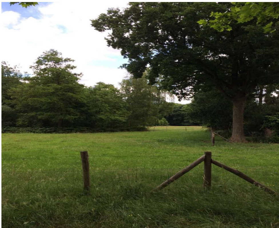
De weide langs de sprengh in lengterichting. Op de grens met de buren rechts een grote eik.