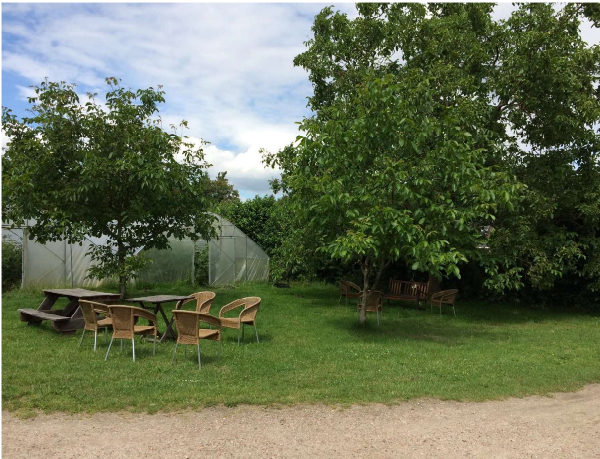
Zitplekken bij de tunnelkas en notenbomen.

Het is belangrijk te blijven zien hoe deze delen verbonden zijn en de compositie als geheel vorm te geven en te verzorgen.