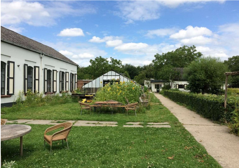
De orangerie met de gerestaureerde kas en het lesgebouw op de achtergrond.

Het voormalige koetshuis, de ijskelder en de orangerie met de gerestaureerde kas zijn de oudste onderdelen van het vroegere Kraaijbeek en huidige Kraaybeekerhof.