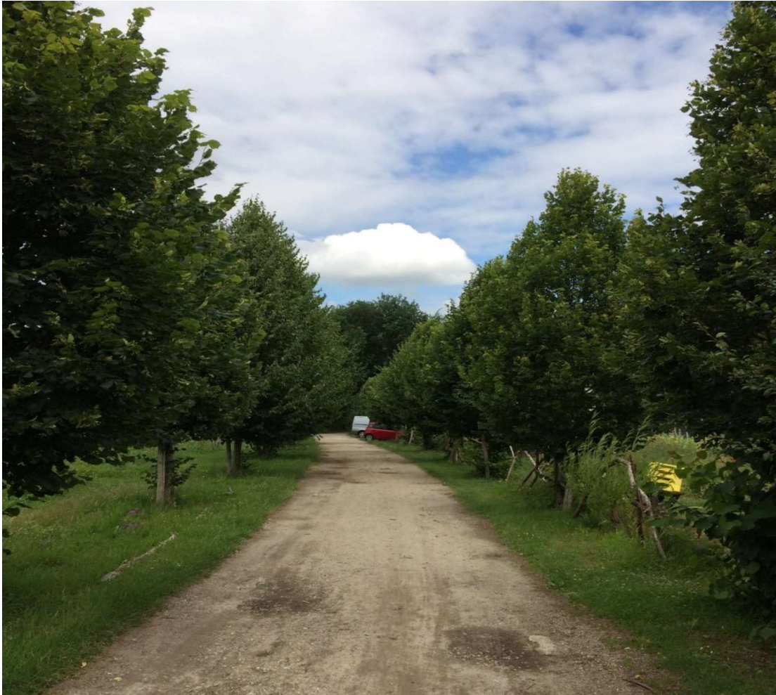
Het eind 2012 geplante lindelaantje als onderdeel van het NSW beplantingsplan

Recent zijn ook de gebouwen door St. BD Grondbeheer verworven, waardoor opnieuw naar het samenhangende geheel van gronden en gebouwen gekeken kan worden.