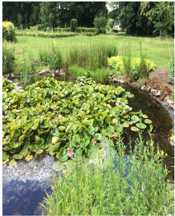
De ronde vijver in het middengebied.