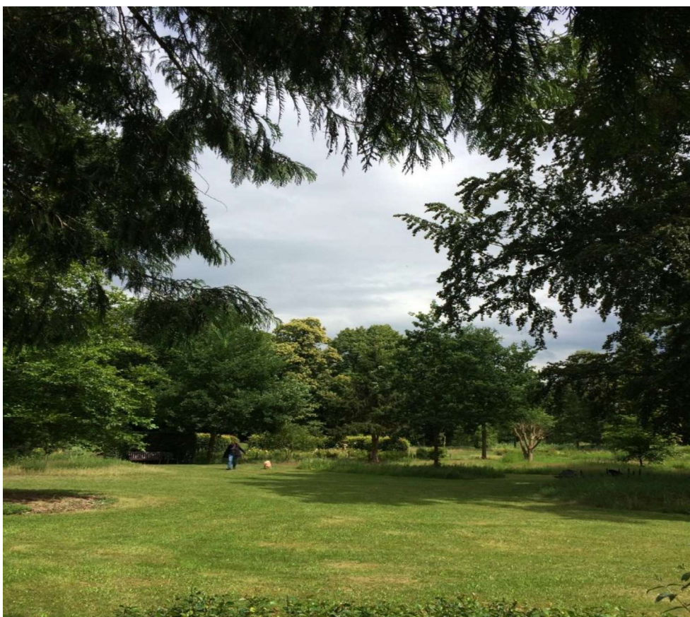
Het in elkaar doorlopen van de tuin van Kraaijbeek en Kraaybeekerhof versterkt het landgoedkarakter van Kraaybeekerhof en vergroot de ruimtelijkheid van het geheel.