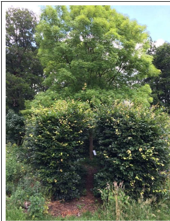
De goudes in het beukenlabyrint.