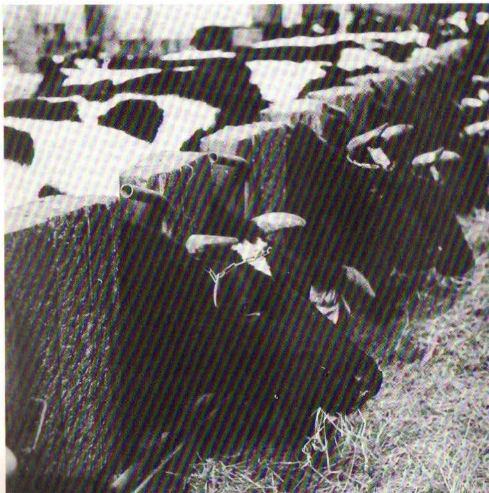
Koelen in de potstal op 'ter Linde'

een dier is niet geestelijk in ontwikkeling. Het dier leeft in zijn lichaam, zijn instinten, zijn soortgebondenheid en hoe vollediger en echter het dit doen kan, des te gezonder is het dier en des te beter en vollediger kwijten wij ons van onze taak als mens om onze huisdieren naar hun aard te houden. Niet het doden van dieren is verwerplijk en fout, maar het houden van dieren op tegennatuurlijke en dier-onwezenlijke wijze.